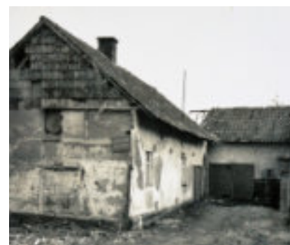
Foto van het oude vakwerkhuisje van Beth, vlak vóór de afbraak ervan.

Op bijgevoegde foto is het witte huisje van Beth te zien en rechts een stukje van de kruidenierswinkel, met in de deuropening Leon Souverijns, zijn vader Giel Souverijns uit het Broek en een neef uit Antwerpen.